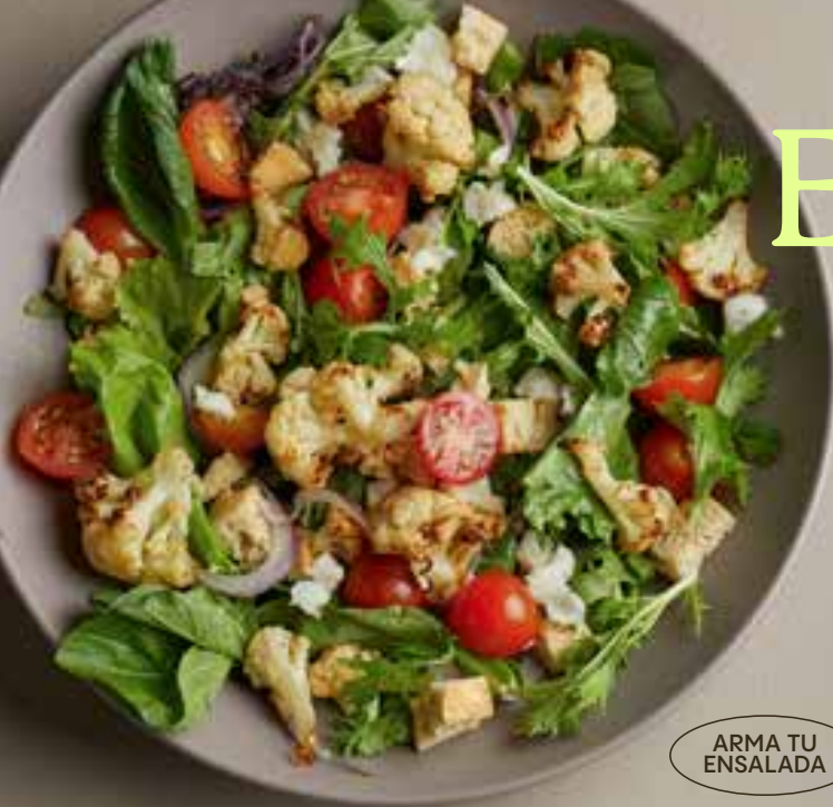
ARMA TU ENSALADA